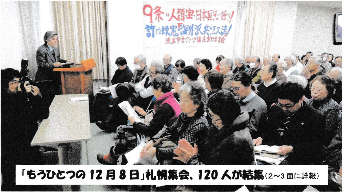
「もうひとつの12月8日」札幌集会、120人が結集(2～3面に詳報)