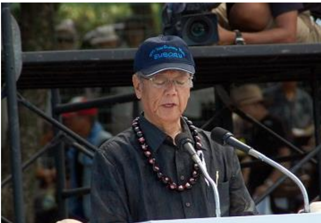
不退転の県民の怒りを訴える翁長雄志知事